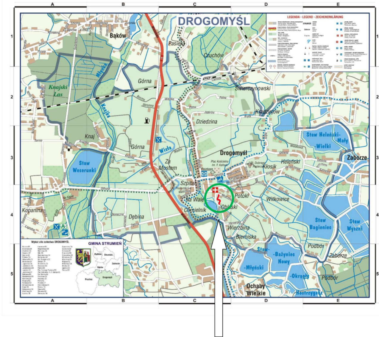
Orientacyjna lokalizacja ulicy Cisowej