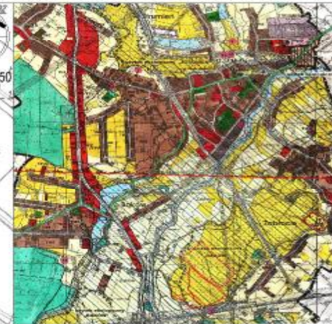
WYRYS ZE STUDIUM LANSZKOWAN I KIERUNKÓW ZAGOSPODAROWANIA PRZESTRZENNEGO GMINY STRUMIEŃ